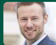
Alex Eder Landrat Landkreis Unterallgäu